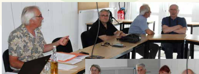
Réunion C.A. du 8 juin 2023